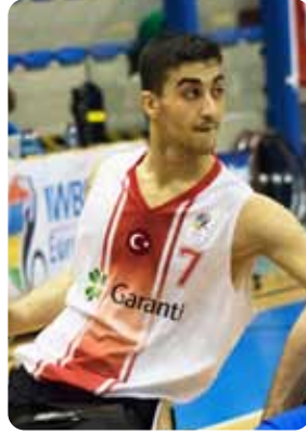
İZMİR'LI STAR 16-17