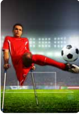
HAYATA VOLE 13-14-15