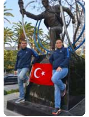
AYILDIZLI GÖREV 24-25