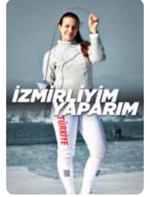
İZMİRLİYİM YAPARIM 10-11