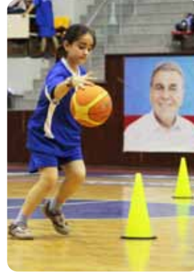
KAPIMIZ HEP AÇIK 20-21