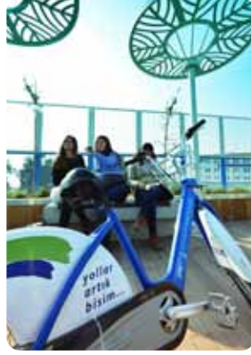
3 YILDA 1 MİLYON KULLANICI 05-06-07