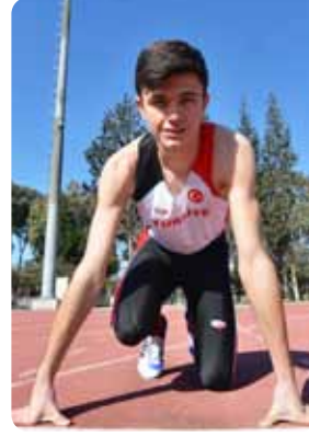
REKOR CANAVARI 08-09