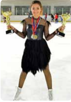
KURSIYER ŞAMPİYON 02-03