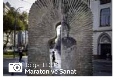
Tolga İLDUN Maraton ve Sanat